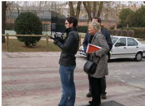
La concejala de Medio Ambiente observa las pruebas

La ciudad del Acueducto, entre los cinco municipios seleccionados por la Fundaci n La Casa que Ahorra y la FRMP