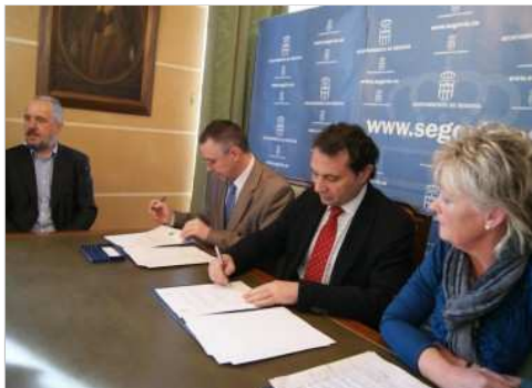
Firma del convenio

El Ayuntamiento firma un Convenio de colaboración con la Fundación la Casa que Ahorra, que comprobará posibles pérdidas de energía en el barrio segoviano.