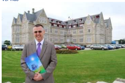
Calle de Casimiro Sáinz, 8-10, 39004 Santander, España