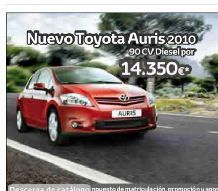
Descarga de catálogo npuesto de matriculación, promoción y apor

Una "casa que ahorra" se basa en factores como la orientación favorable, el diseño compacto, el aislamiento óptimo, los vidrios de alta eficiencia térmica, la ventilación adecuada y el uso de materiales sostenibles. Además de su positivo efecto energético, una "casa que ahorra" también incrementa el confort acústico de la vivienda (que es un gran problema en numerosas zonas de muchas ciudades españolas) sin olvidar la protección pasiva contra incendios. Nos ofrece en definitiva confort, salud y seguridad con el mínimo consumo energético, gasto económico e impacto medioambiental.