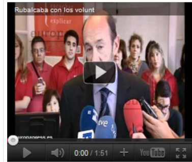
Rubalcaba con los voluntarios de su campaña

Ayuda contactos | Publicidad | Aviso legal | Site Index | Quienes somos | Gobierno | Parlamento | Ayuntamiento |