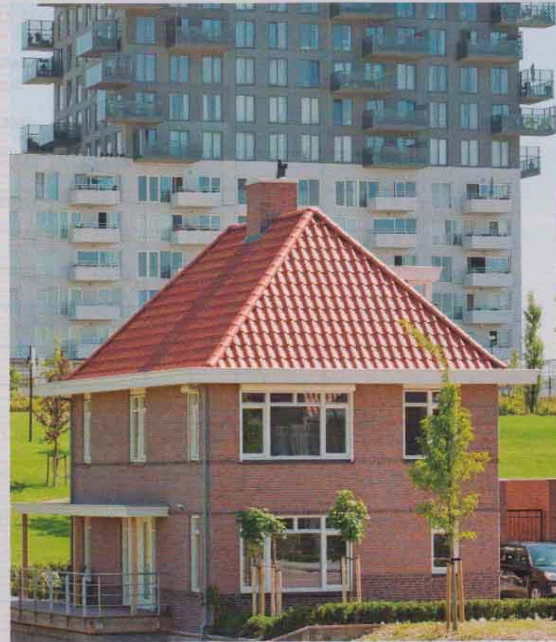
La inversión es muy superior en el caso de una vivienda unifamiliar que en el de una vivienda en bloque

En el ámbito fiscal, la mayor repercusión se obtendrá a través de los impuestos de más alcance social.