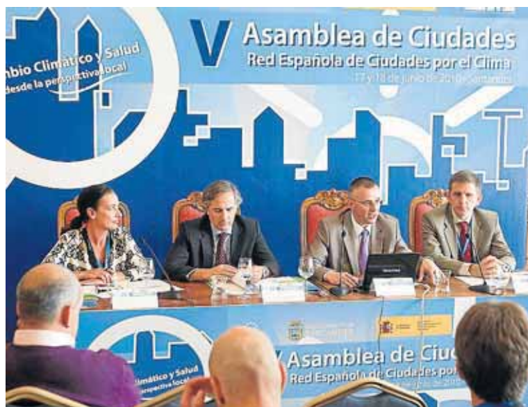
Las reuniones de la red se han celebrado en La Magdalena. ■ R. RUIZ

Los edificios consumen un 41% de la energía total en la Unión Europea y sin embargo hace ya tiempo que se disponemos de tecnologías para reducir muy significativamente su gasto, lo cual tendría un gran impacto positivo en la econo-