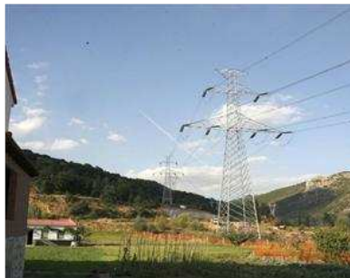
El estudio se realizará en cinco municipios. M. MARCOS

La Federación Española de Municipios y Provincias lleva desde hace años trabajando en todo lo relacionado con las políticas de eficiencia energética.